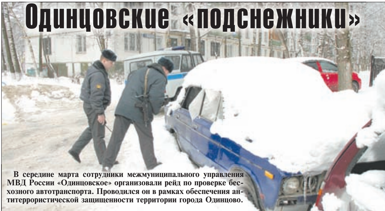
В середине марта сотрудники межмуниципального управления МВД России «Одинцовское» организовали рейд по проверке бесхозного автотранспорта. Проводился он в рамках обеспечения антитеррористической защищенности территории города Одинцово.

ДЛЯ НАЧАЛА стоит пояснить, что брошенные у обочин автомобили не только мешают проезду. Их можно использовать для закладки взрывных устройств. В ходе рейда именно на оставленные в людных местах бесхозные автомашины силовики обращали пристальное внимание.