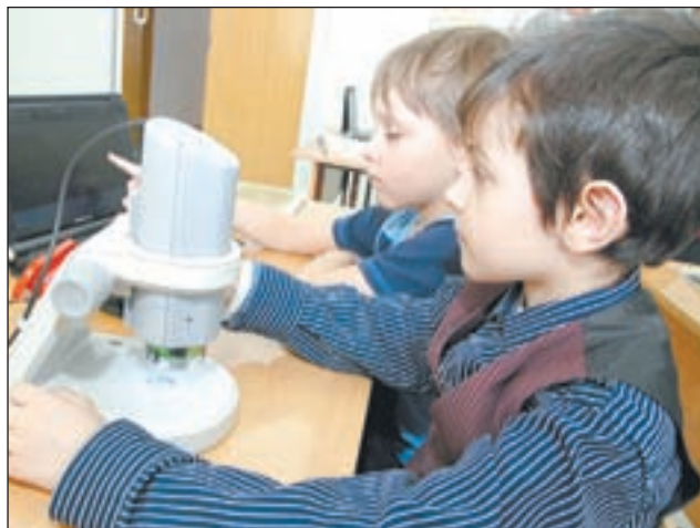
• Первоклашкам доверяют цифровые микроскопы.

— У нас 58 процентов учебных кабинетов имеют выход в Интернет. 85 процентов учителей постоянно, охотно и активно используют компьютер в своей учебной деятельности. Ребята с удовольствием идут на урок, потому что там они не пассивные слушатели, а создатели учебного материала. Им нравится, что речь учителя дополняется красочным визуальным рядом — иллюстрациями на интерактивной доске. Ребята на уро-