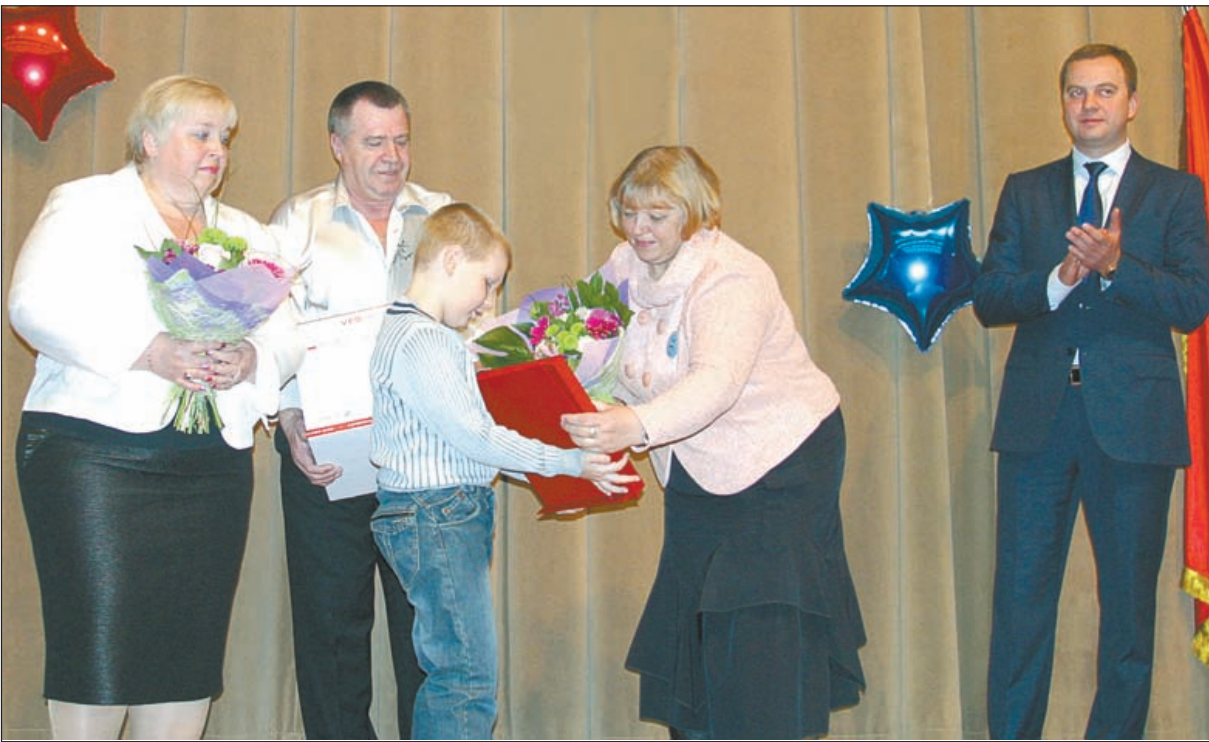
• Общий трудовой стаж династии Киевцевых — более 200 лет!