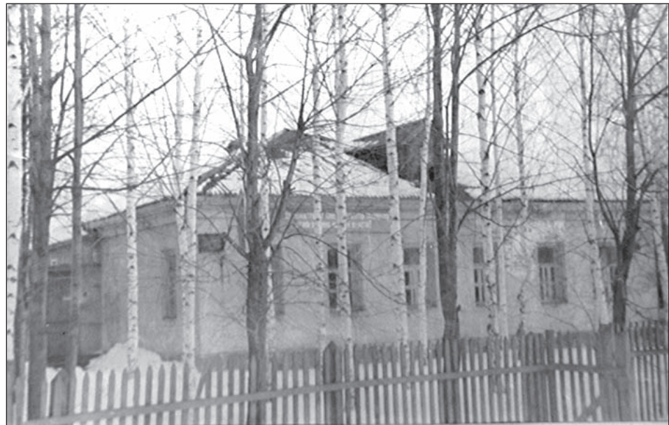
• В этом здании с первых дней размещалось Успенское отделение милиции.

— За первый квартал 2012 года по общим показателям у нас чуть менее 80 процентов рас-