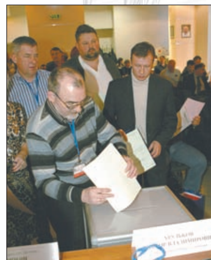
• Рабочий момент общего собрания.

Кроме того, аппарат партнерства принимает активное участие в работе Национального объединения строителей, а сам генеральный директор состоит в рабочей комиссии Центрального федерального округа «Нострой» по противодействию коммер-