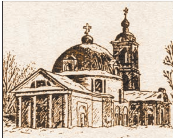
• Церковь Гребневской Божьей Матери, построенная в 1802 г. в Одинцове. Рис. Н. Митронова.

В течение следующего столетия Одинцово отдается во владение различным лицам. В конце XVI века оно стало поместьем Исленьевых, ветви знаменитого рода бояр Вельяминовых-Воронцовых. По описанию 1627 года часть сельца принадлежала Степану Ивановичу Исленьеву, а другая полови-