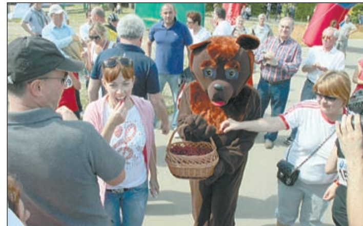
• Завершился День леса коллективным забегом участников воскресника, «велокроссом» для наиболее активных и малиной от «медведя».