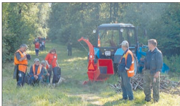
• Техника по утилизации древесных отходов работает без перерыва.

сделать лыжероллерную трассу более гостеприимной: расширить и осветить беговые дорожки, оборудовать на головной поляне помещения, где спортсмены могли бы переодеться, привести в порядок инвентарь, перекусить и так далее.