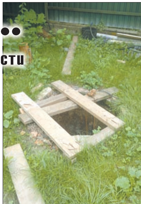
• Здесь гуляли дети.

Дальше — больше. Перечислять все без исключения зафиксированные нарушения было бы очень долго, — поэтому остановимся на основных. Охрана объ-