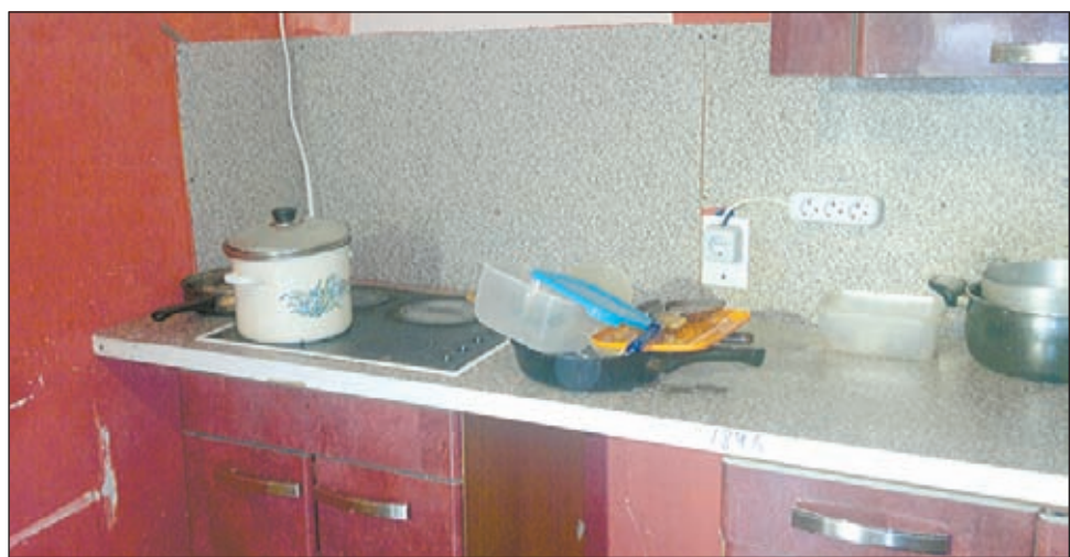
• Кухня детского сада.

екта с массовым пребыванием малолетних детей никем не осуществлялась. На территории дetsада велось строительство дополнительного помещения, причем место работ огорожено не было, зато внимание проверяющих «привлек» зияющий темнотой и пустотой открытый канализационный люк. Ни веранд, ни хотя бы примитивных навесов, где дети могли бы укрыться