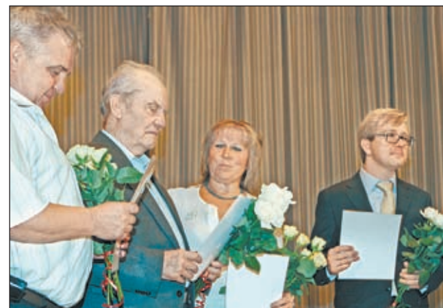
• Благодарственные письма главы вручаются инициативной группе по строительству памятников погибшим воинам.