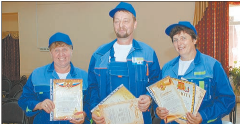
• Отмечены за профессионализм.

Его провели управление жилищно-коммунального хозяйства администрации района и Одинцовская территориальная организация МООО профсоюза работников жизнеобеспечения. В смотре-конкурсе, посвященном 55-летию города Одинцово, приняли участие представители очень важных и необходимых профессий. Без них, по общему признанию, нет уюта и комфорта в нашей повседневной жизни.