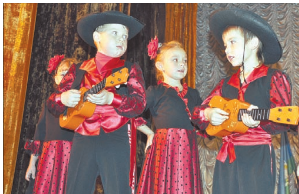
• Талантов в сельском поселении Захаровское хоть отбавляй. И людям старшего поколения, и малышам есть что показать своим зрителям.