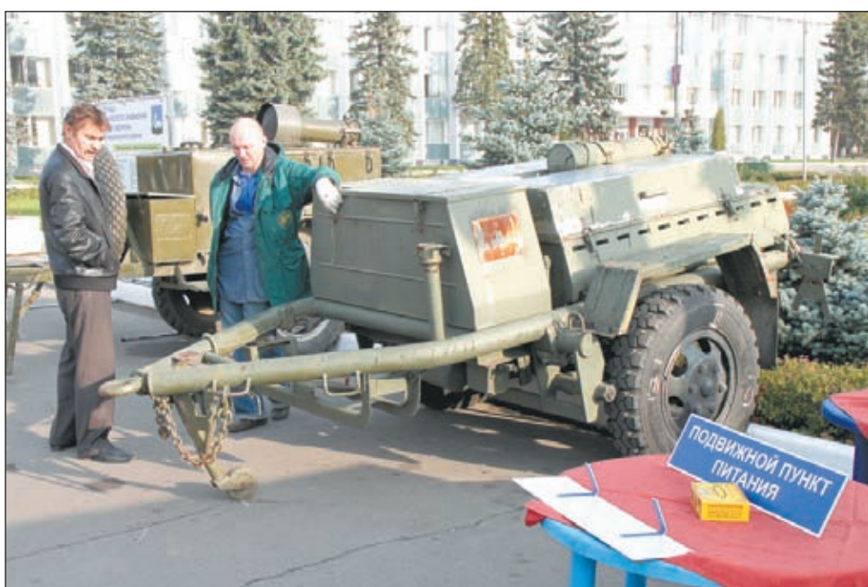
• В составе подвижного пункта питания — две полевых кухни.