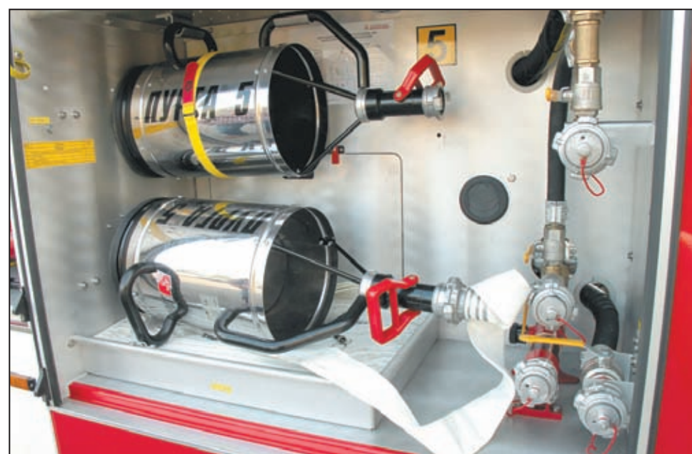
• Установка комбинированного тушения пожаров (УКТП) «Пурга-5».