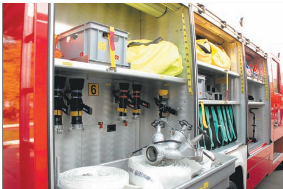
• С таким арсеналом огнеборцы района справятся с любым возгоранием.