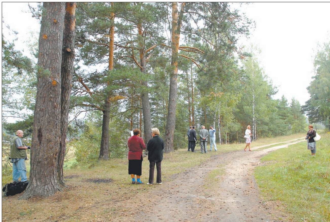
• Никольские сосны признаны «памятником живой природы» местного значения.